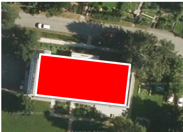
Umístění panelů a technologie FVE na střeše MŠ

Předmětem projektu je elektroinstalace fotovoltaické elektrárny 28,67 kWp (dále jen FVE) na budově ležící na výše uvedené parcele daného kat. území. Projekt řeší instalaci fotovoltaických panelů, napojení DC části do střídače, napojení AC části střídače do rozvaděče RHFVE a dále napojení do RE1 rozvaděče technologie budovy. Dokumentace je zpracovaná dle požadavků investora a ostatních profesí. Jsou použity monokrystalické fotovoltaické panely o jmenovitém výkonu 470 Wp, rozměru 2094 x 1038 x 30 mm s rozmístěním podle výkresů na ploché střeše v celkovém počtu 61 ks. Dále jsou vně objektu použity dva střídače SE5K a SE 25K o jmenovitém výkonu: 5 a 25kVA + výkonové optimalizéry → zajišťující bezpečný zásah jednotek PO na střešním pláště (napětí do 400V).